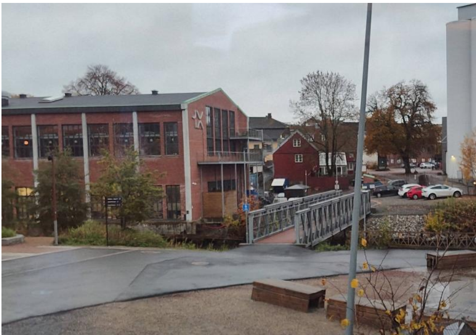
bro ved Verket

På tampen av 2025 forventet man så videre arbeid i ad-hoc arbeidsgruppen til etter at fristen for offentlig ettersyn av planen for nye Moss stasjon går ut og man får hentet inn alle innspill til plansaken. Dersom det er behov for videre avklaringer av veisystemet rundt stasjonsområdet vil arbeidsgruppen fortsette arbeidet i 2026.