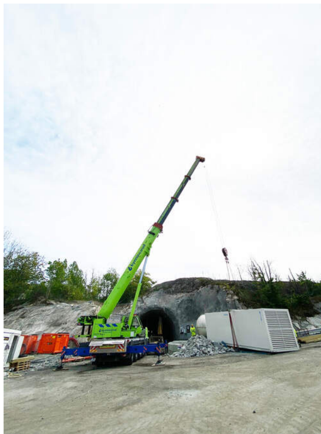
Til glede for naboene ble en ny og bedre lydisolert vifte satt opp på Verket i mai.