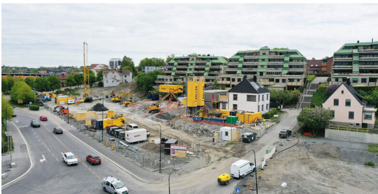
I Kransen har vi den siste måneden gjennomført kalibrering av jetinjisering, med sement-peler som settes tett i tett. Produksjonsfasen begynner neste måned.