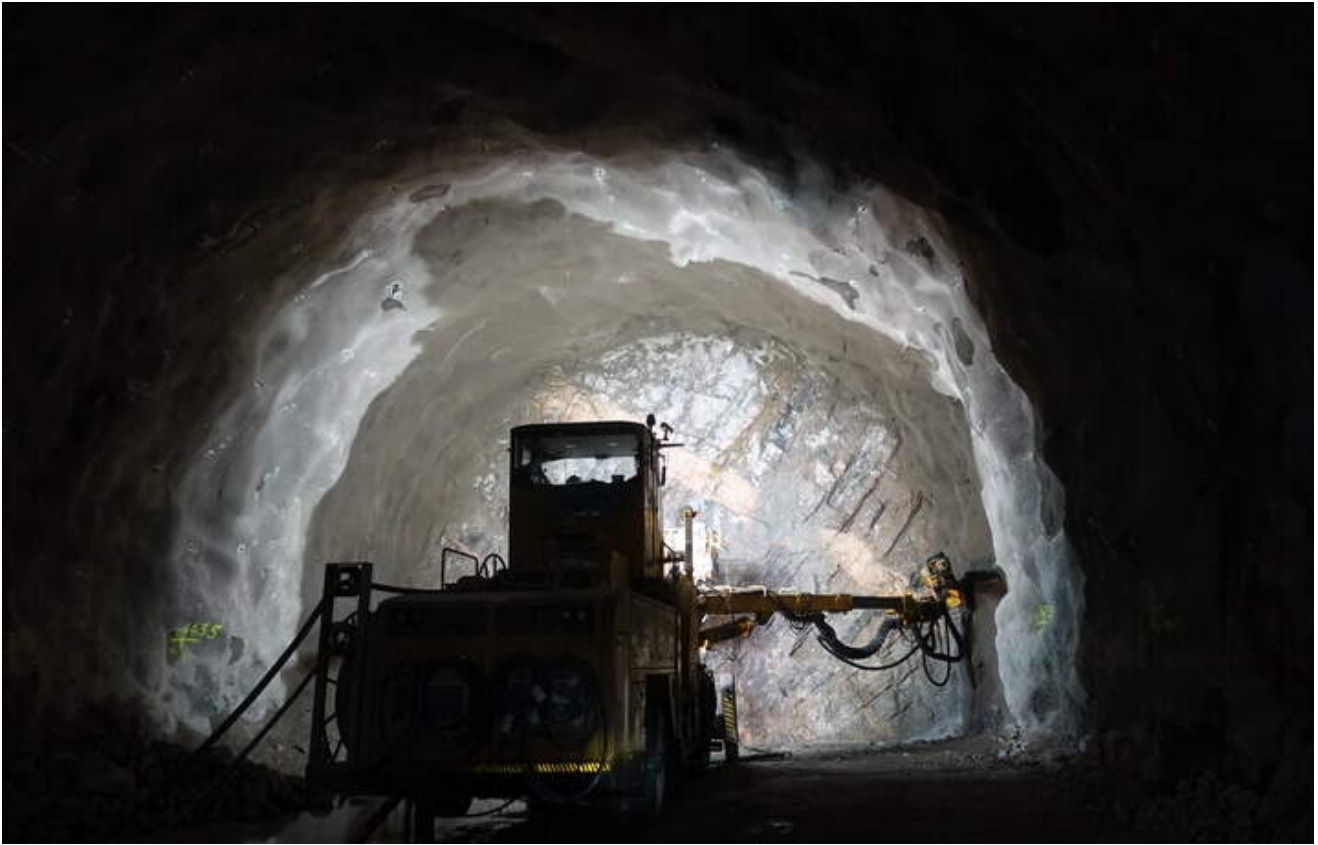
Vi er nå i gang med å drive jernbanetunnelen mellom Mosseskogen og Kransen. Bildet av boremaskinen i Mossetunnelen er tatt 19. mai.